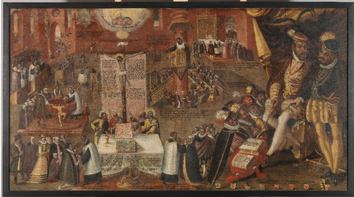
Abbildung 2 Andreas Herneisen: Gedenkbild auf die Übergabe der Augsburger Konfession 1530 an Kaiser Karl V., 1599

Martin Luther kritisierte die Praxis und den Ritus der Kirche. Seiner Meinung nach, könne sich ein Christ nur auf Christus (sola Christus), Gottes Gnade (sola gratia), den Glauben (sola fide) und die Schrift (sola scriptura) berufen. Damit schloss er nicht nur den viel kritisierten Ablass aus dem neuen Glauben aus, sondern auch viele Sakramente.