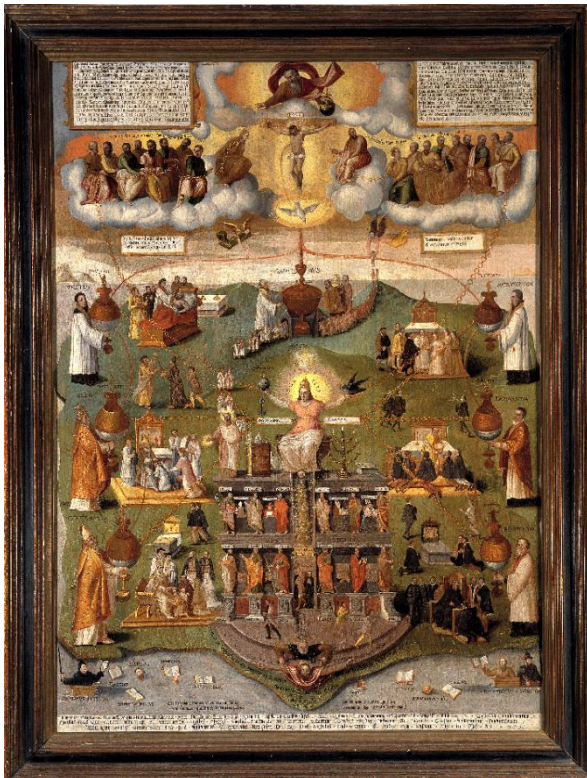
Abbildung 1 Die katholische Kirche und ihre Gnadenlehre, 1575/84